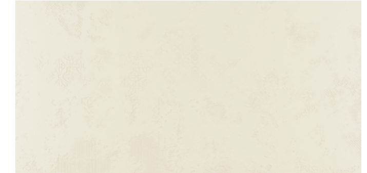
Backstage WH DEC 60x120 cm / 24x48"