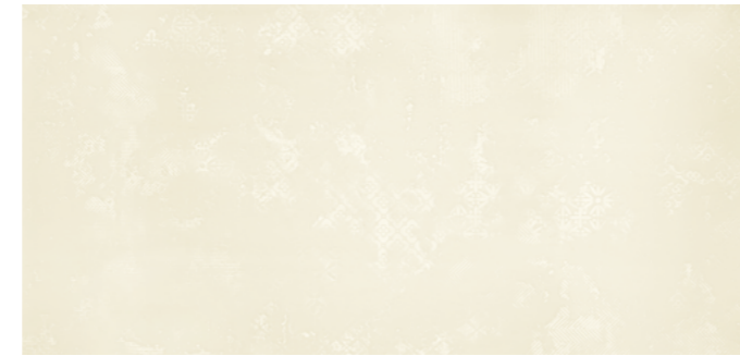
Backstage LUMINOUS 60x120 cm / 24x48"

Considerado el corazón de los espectáculos, es en el backstage que la magia sucede. Es donde el staff se prepara y no deja escapar ningún detalle para producir una atracción perfecta. Esta colección desempeña ese papel y es parte de la preparación y composición de espacios espectaculares.