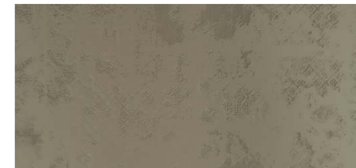
Backstage TARTAN DEC 60x120 cm / 24x48"