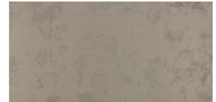
Backstage DGR DEC 60x120 cm / 24x48"