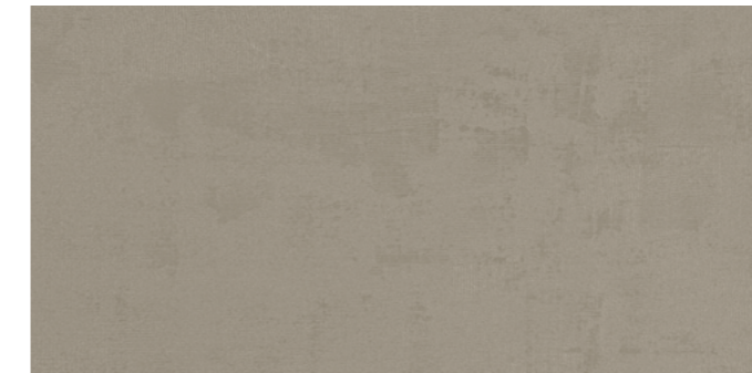
Backstage DGR 60x120 cm / 24x48"