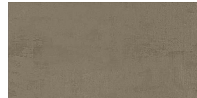
Backstage TARTAN 60x120 cm / 24x48"