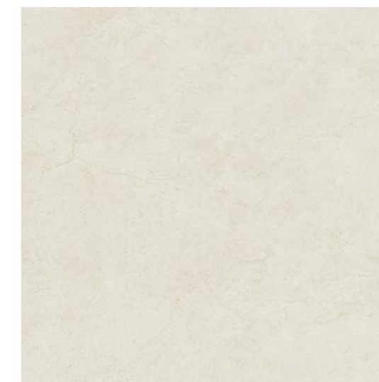
Maestro Stone OFW 60x60 cm / 24x24"