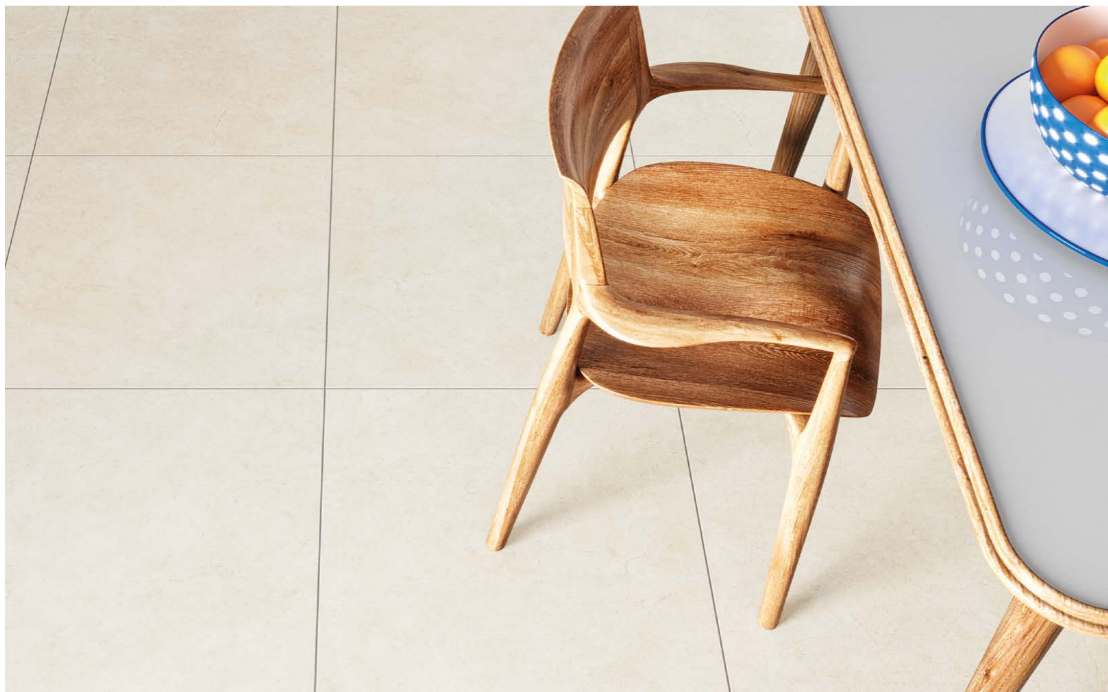
Maestro Marble WH NAT 60x60 cm / 24x24"

Continuidad y amplitud: piso y pared con el mismo visual.