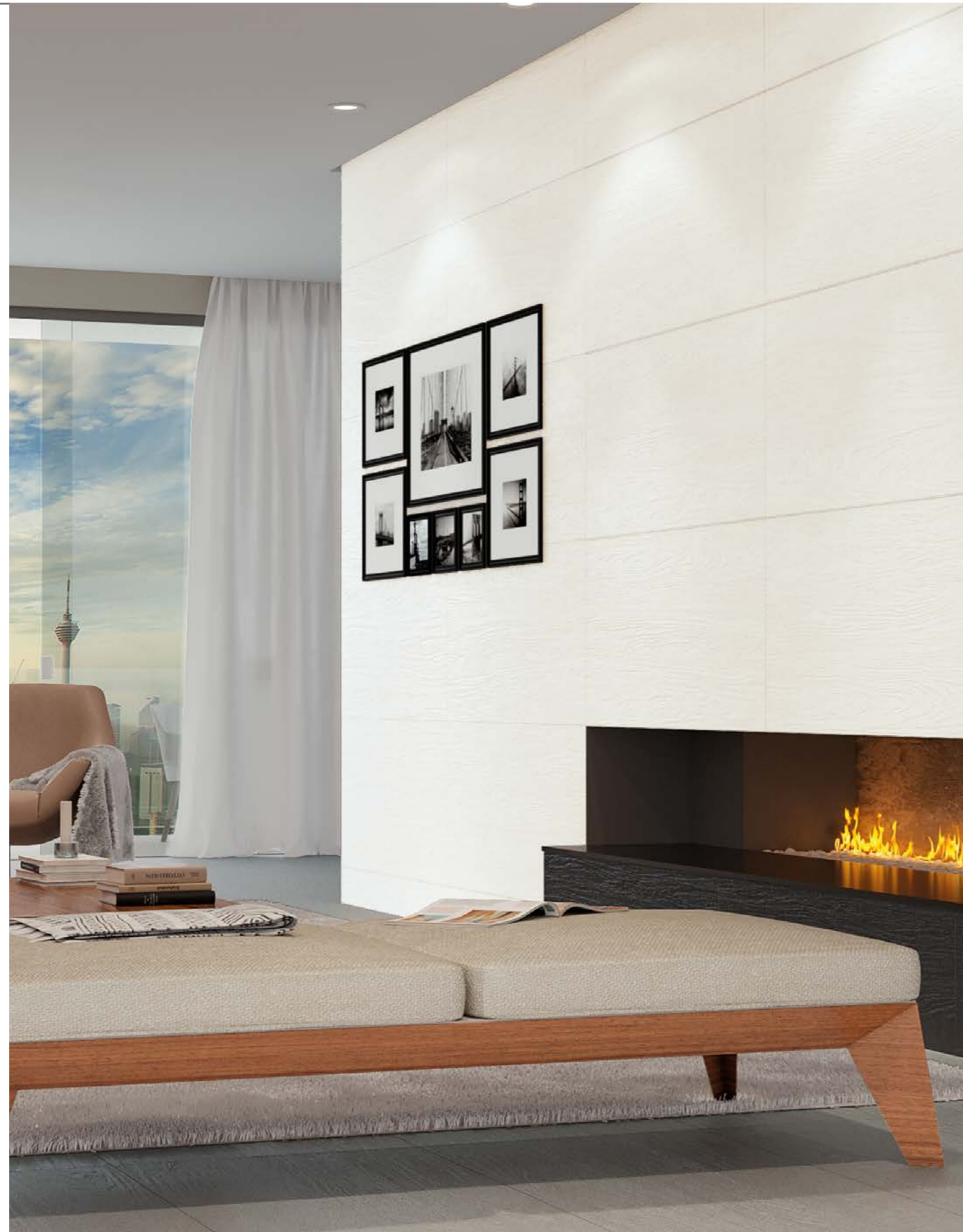
Woodstock WH NAT 60x120 cm / 24x48" Woodstock BK NAT 60x120 cm / 24x48" Woodstock DGR NAT 60x120 cm / 24x48"

La inspiración para el design y para el gran formato de esta colección viene de los árboles milenarios y gigantes encontrados en los bosques del mundo. Para hacer una releitura moderna de esos monumentos vegetales, aquí, el design presenta un efecto carbonizado con tono oscuro, imponente y homogéneo. Para ofrecer contrastes y composiciones, los tonos de gris y blanco son integrados a la colección, otorgando nobleza a los espacios.