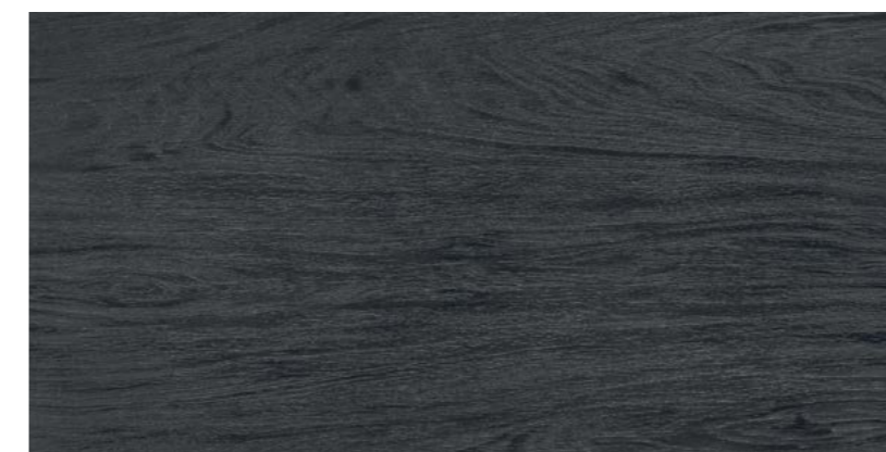
Woodstock BK 60x120 cm / 24x48"