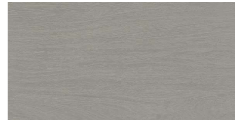
Woodstock DGR 60x120 cm / 24x48"