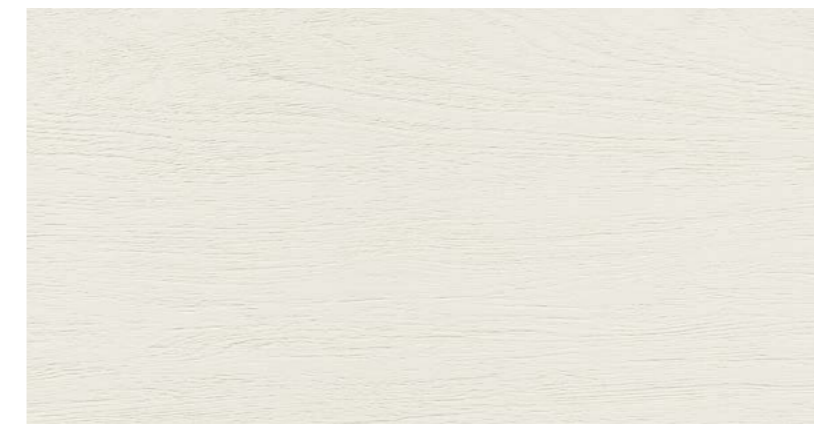
Woodstock WH 60x120 cm / 24x48"