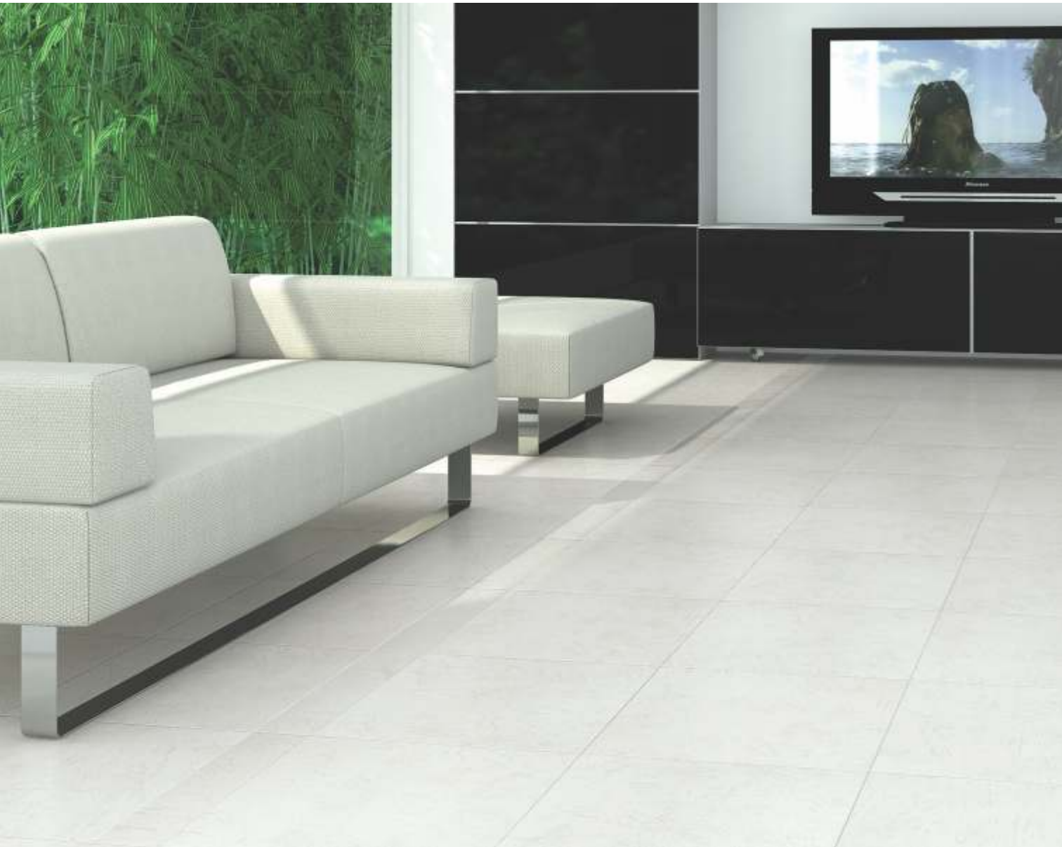
Pelle WH 45x45 cm / 18x18"