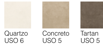
Quartzo USO 6