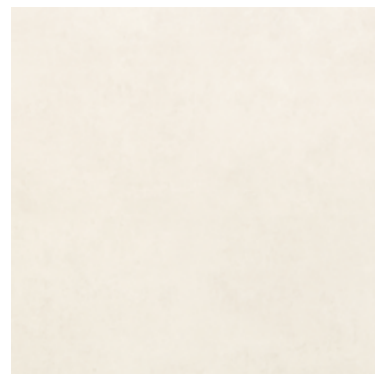
Urban Quartzo 90x90 cm / 36x35"

Cores e formatos Color and sizes | Colores y formas