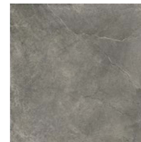
Cement Stone DGR 90x90 / 36x36" POL / NAT / HARD RET V3 - USO 5