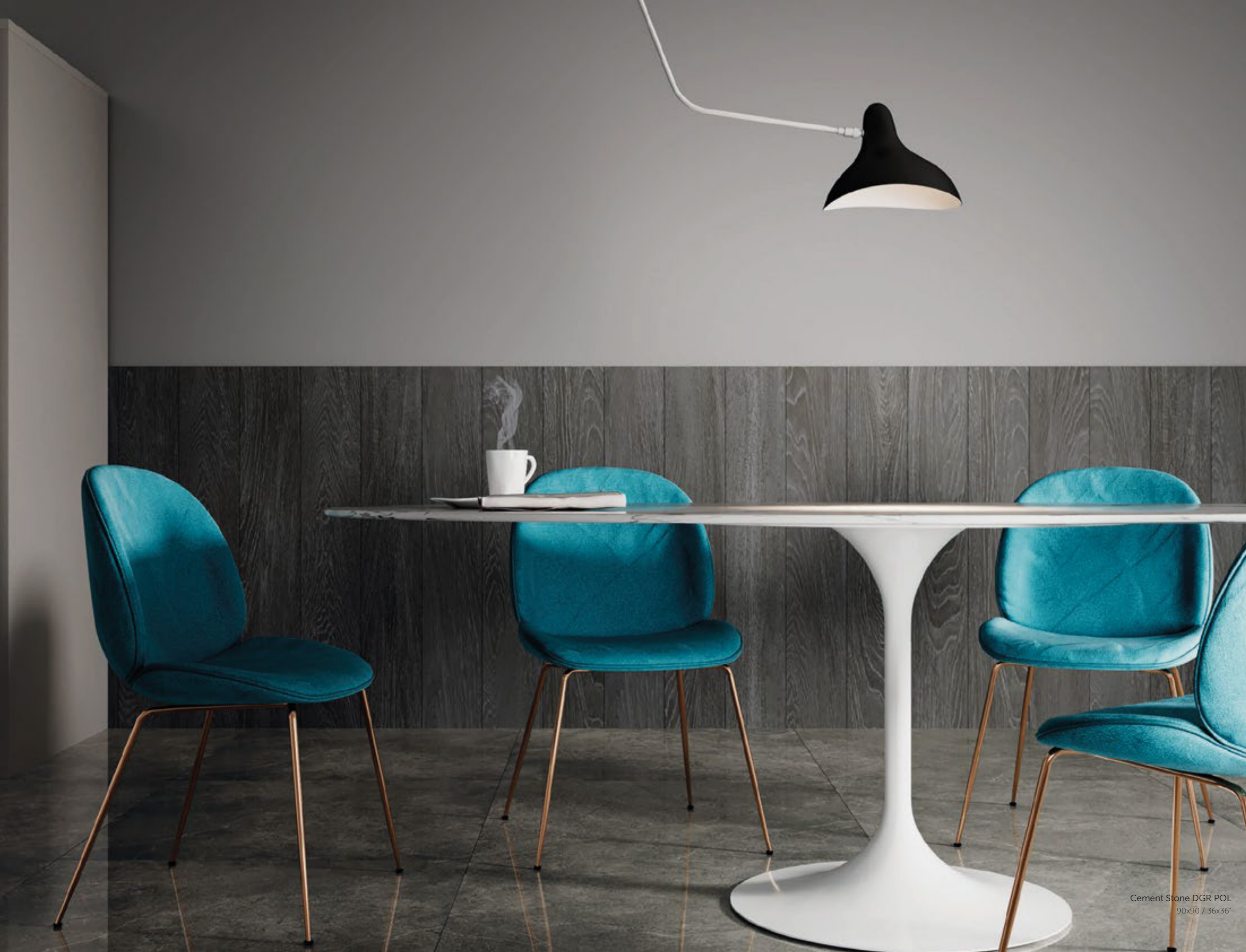
Cement Stone DGR POL 90x90 / 36x36"