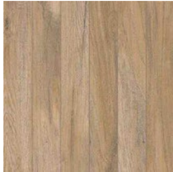
MAT HARD BOLD USO 5 V3

Cores e formatos Colors and sizes | Colores y formatos