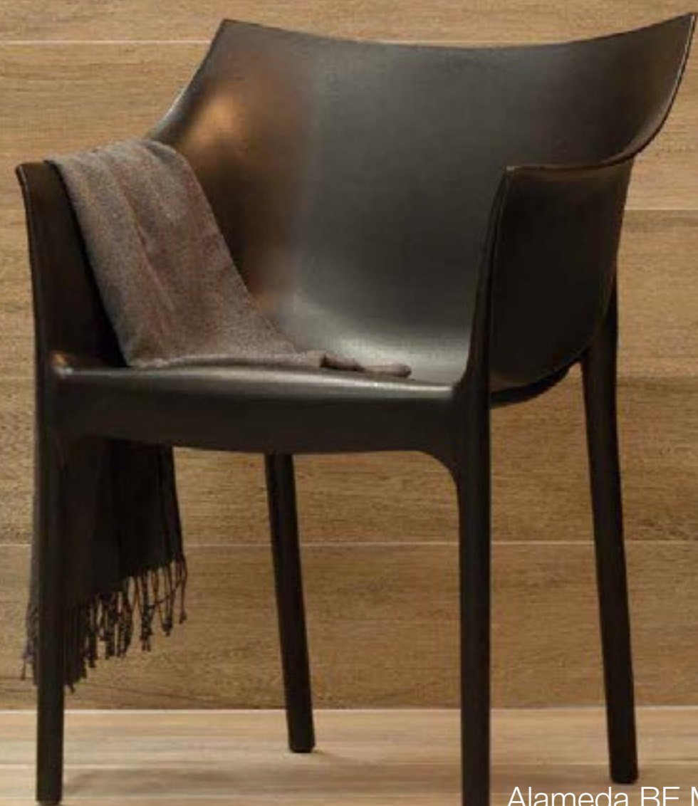
Alameda BE MAT 20x120 cm / 8x48" RET