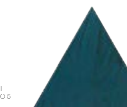
Bailarinas Tri DGN 17x17 cm 7x7"