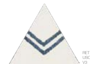
Bailarinas Tri Dec 1 17x17 cm 7x7"