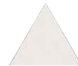
Bailarinas Tri WH 17x17 cm 7x7"