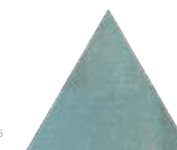
Bailarinas Tri GN 17x17 cm 7x7"