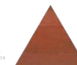
Bailarinas Tri RD 17x17 cm 7x7"