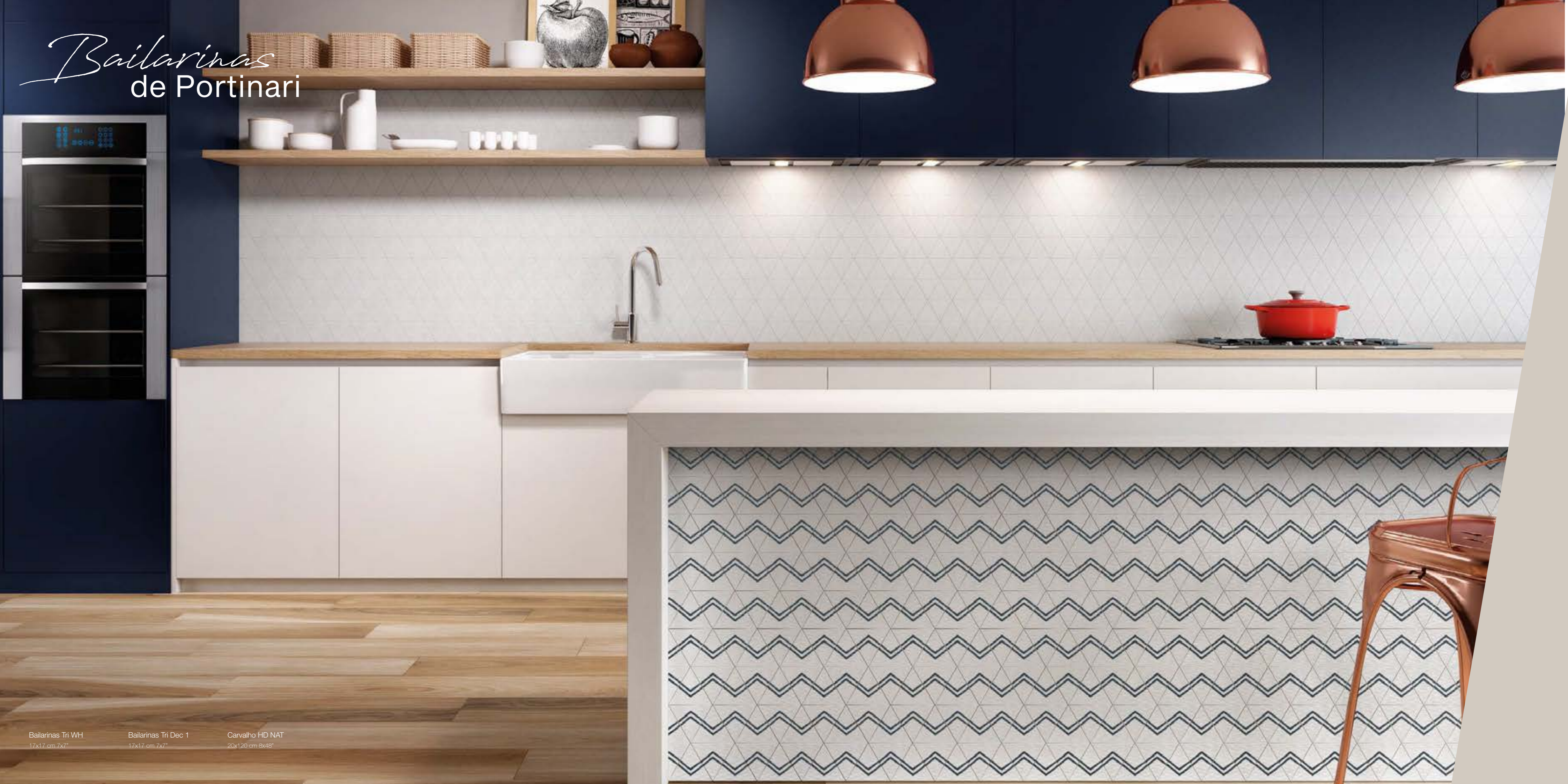
Bailarinas Tri WH 17x17 cm 7x7"