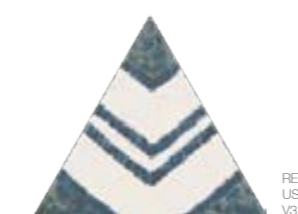
Bailarinas Tri Dec 2 17x17 cm 7x7"