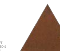
Bailarinas Tri BW 17x17 cm 7x7"