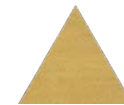
Bailarinas Tri YL 17x17 cm 7x7"