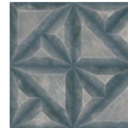
Extreme GR 60x60 cm / 24x24"