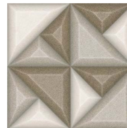
Extreme NO Mix 60x60 cm / 24x24"

Las formas urbanas de la Colección Extreme son una invitación a explorar la volumetría de las piezas. Con el movimiento de los relieves tridimensionales, grandes paneles y fachadas increíbles pueden ser creados con iluminación diferenciada. La inspiración en bloques de hormigón ganó nueva apariencia en colores del cemento tradicional, grafito moderno y un mix de tonos cálidos en la misma pieza. Al montar un panel, el encuentro de los relieves da la impresión de ser una pieza única. Para formar diferentes paginaciones, solo rotar el producto.